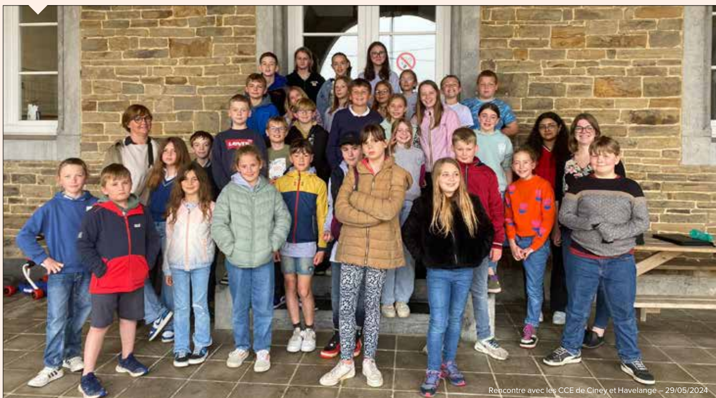
Rencontre avec les CCE de Ciney et Havelange – 29/05/2024

Nous attendons avec impatience la rentrée scolaire afin d'élire les nouveaux conseillers de cinquième primaire et vivre une nouvelle année remplie de nouveaux projets!